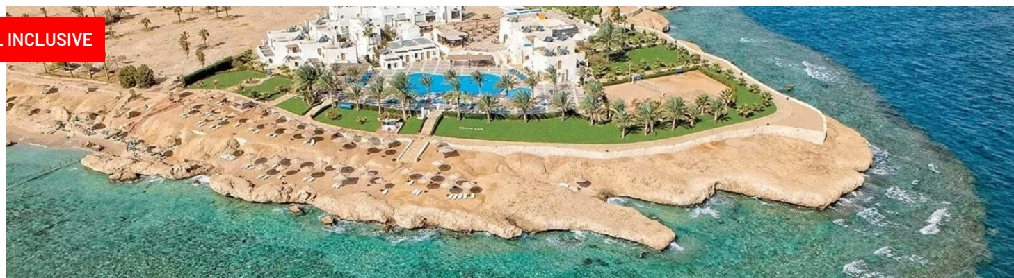
Quote individuali volo + soggiorno in camera doppia all inclusive