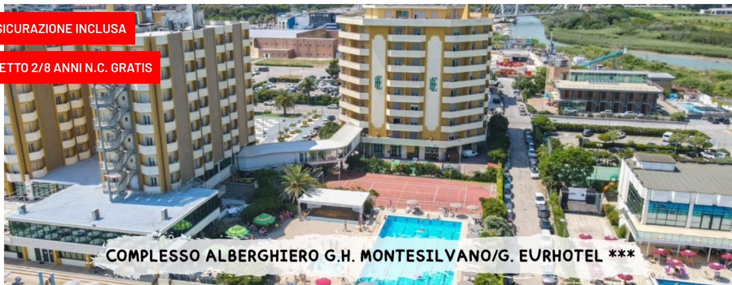
COMPLESSO ALBERGHIERO G.H. MONTESILVANO/G. EURHOTEL ***