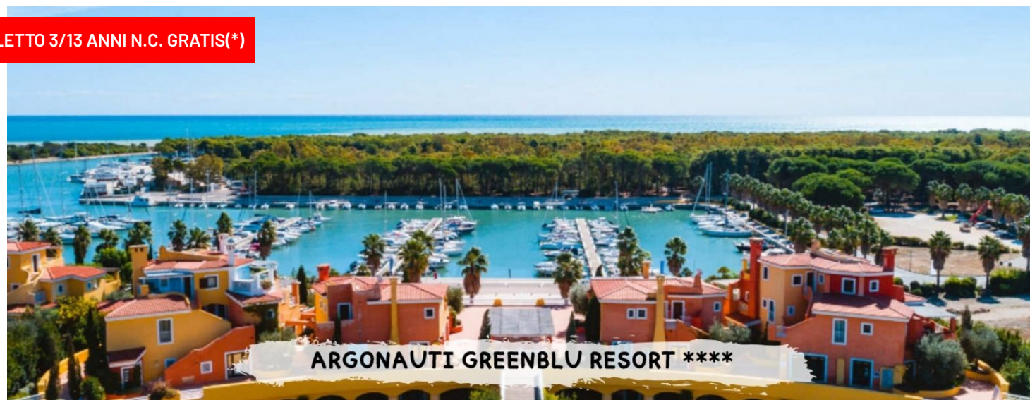
ARGONAUTI GREENBLU RESORT ****