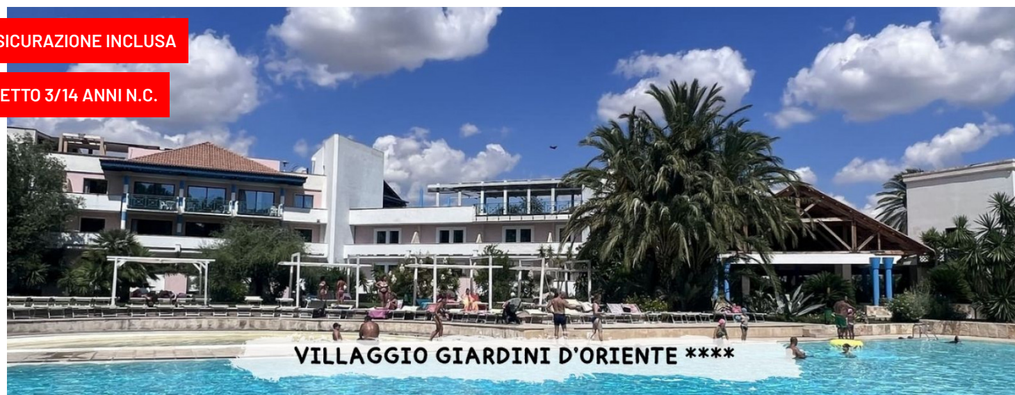
VILLAGGIO GIARDINI D'ORIENTE ****