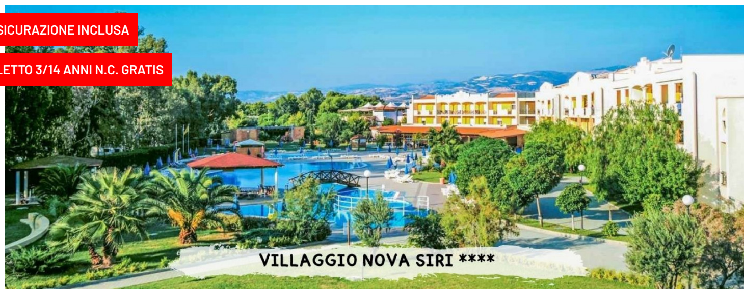
VILLAGGIO NOVA SIRI ****

quote a persona in pensione completa con soft all inclusive