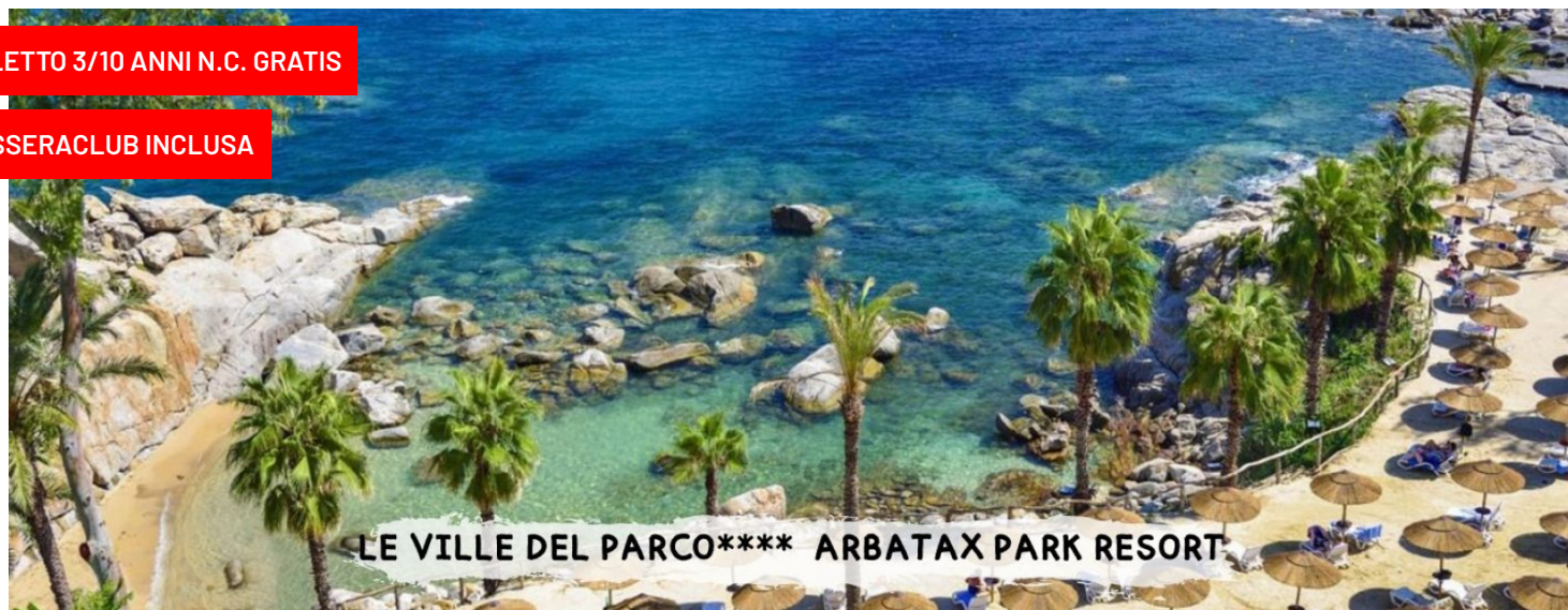
LE VILLE DEL PARCO**** ARBATAX PARK RESORT

sistemazione "le ville del parco" – camera standard pensione completa – bevande incluse – tessera club inclusa pacchetti con nave + auto o in solo soggiorno -7/10/11 notti