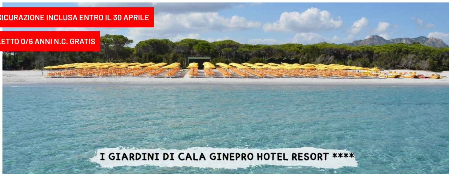
I GIARDINI DI CALA GINEPRO HOTEL RESORT ****