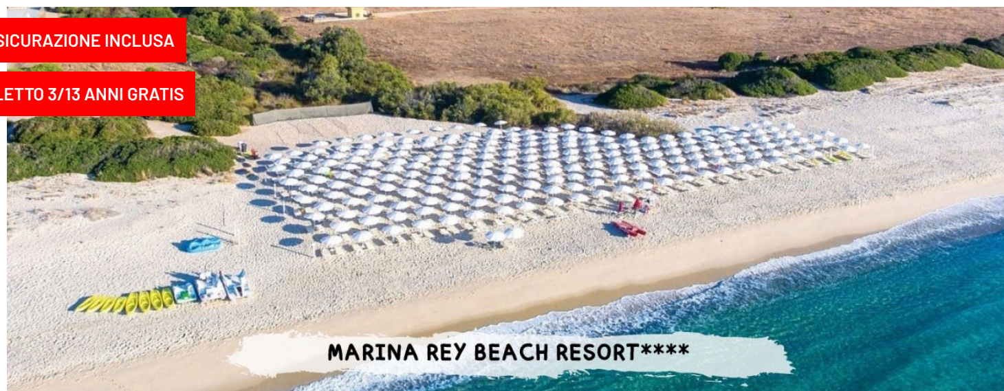
MARINA REY BEACH RESORT****