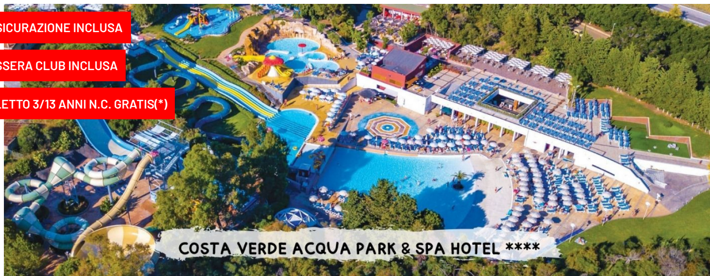
COSTA VERDE ACQUA PARK & SPA HOTEL ****