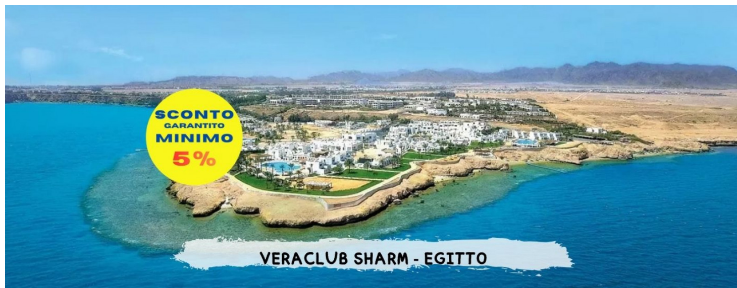
VERACLUB SHARM - EGITTO