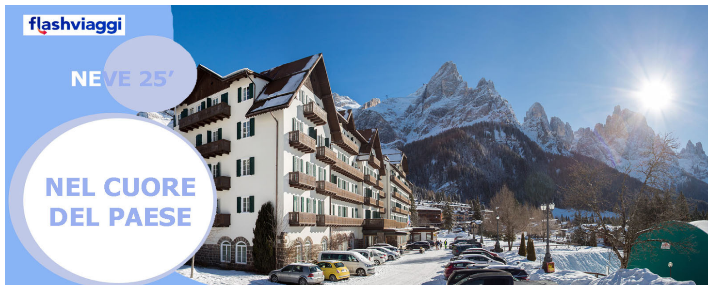
TH San Martino di Castrozza - trattamento di mezza pensione, bevande ai pasti escluse