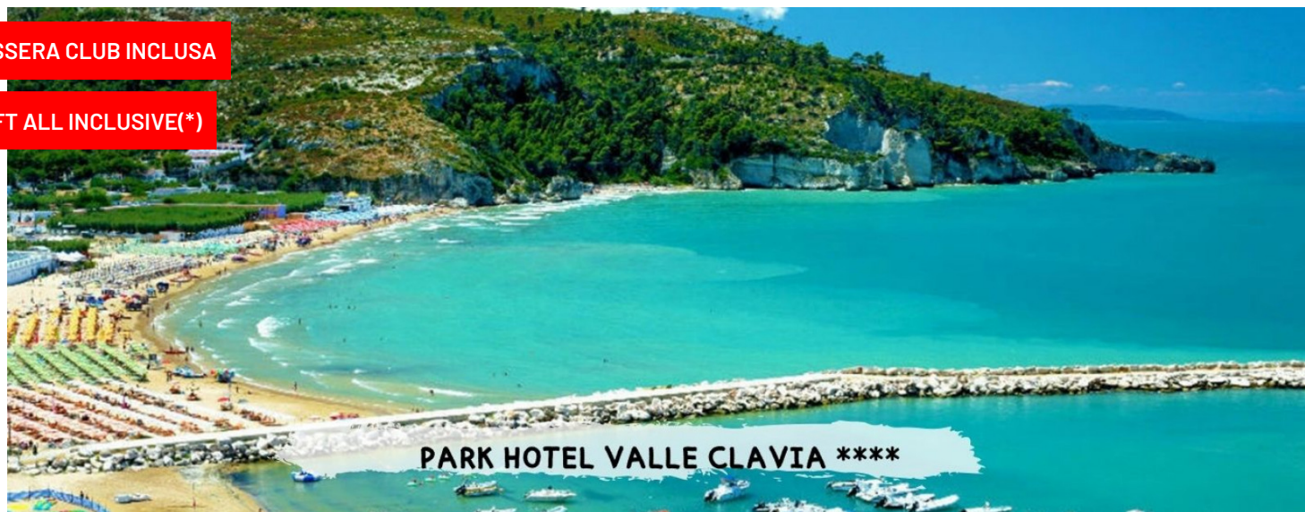
PARK HOTEL VALLE CLAVIA ****

quote a persona a settimana in all soft inclusive(*)