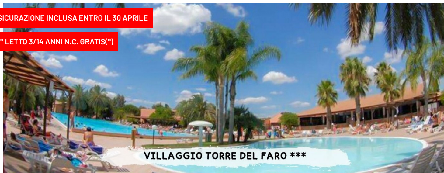
VILLAGGIO TORRE DEL FARO ***

quote a persona in pensione completa - bevande incluse in formula "mondotondo club"