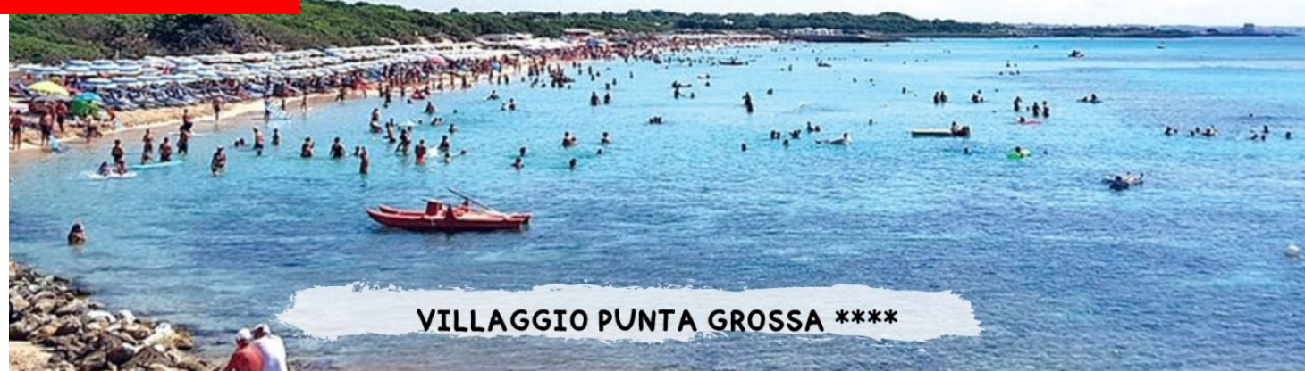
VILLAGGIO PUNTA GROSSA ****