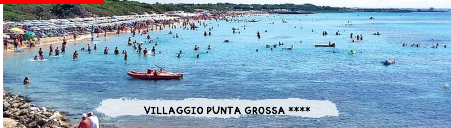
VILLAGGIO PUNTA GROSSA ****