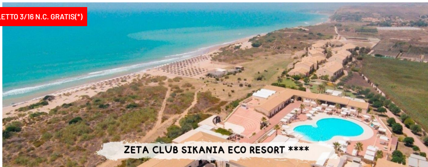
ZETA CLUB SIKANIA ECO RESORT ****